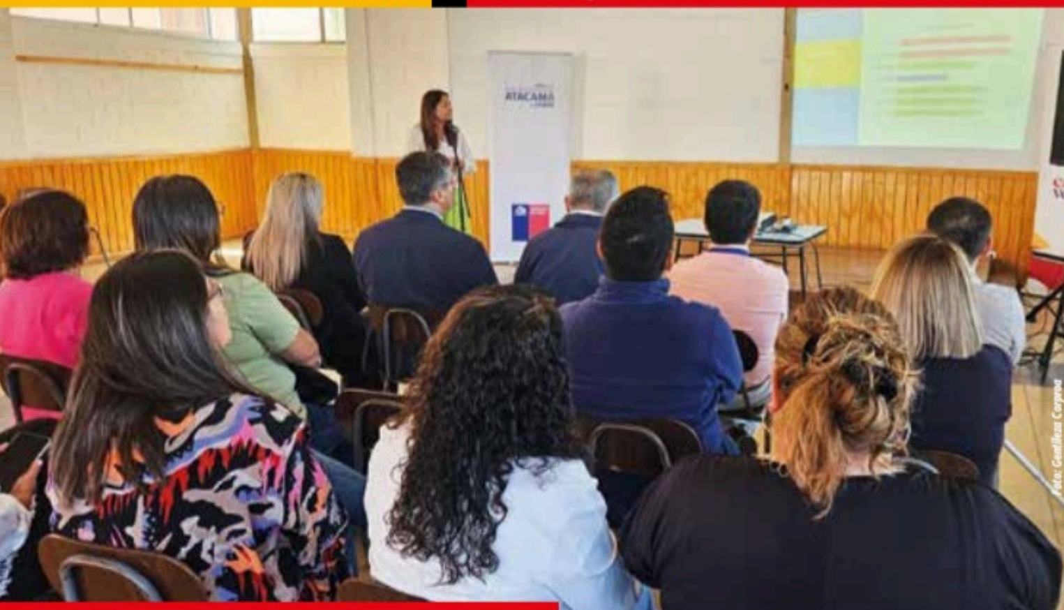
Programa de formación de proveedores locales en Tierra Amarilla.

punto que destaca Arredondo es que “la tecnología actúa hoy como un gran habilitador, permitiendo conectar y optimizar procesos de formas impensadas hace algunos años. El uso de datos posibilita la optimización de flotas, el monitoreo de impactos ambientales en tiempo real junto a las comunidades, la mejora de la logística con proveedores o la coordinación transparente de planes de cierre y post-cierre con las autoridades, reduciendo los costos de transacción asociados a la colaboración”.