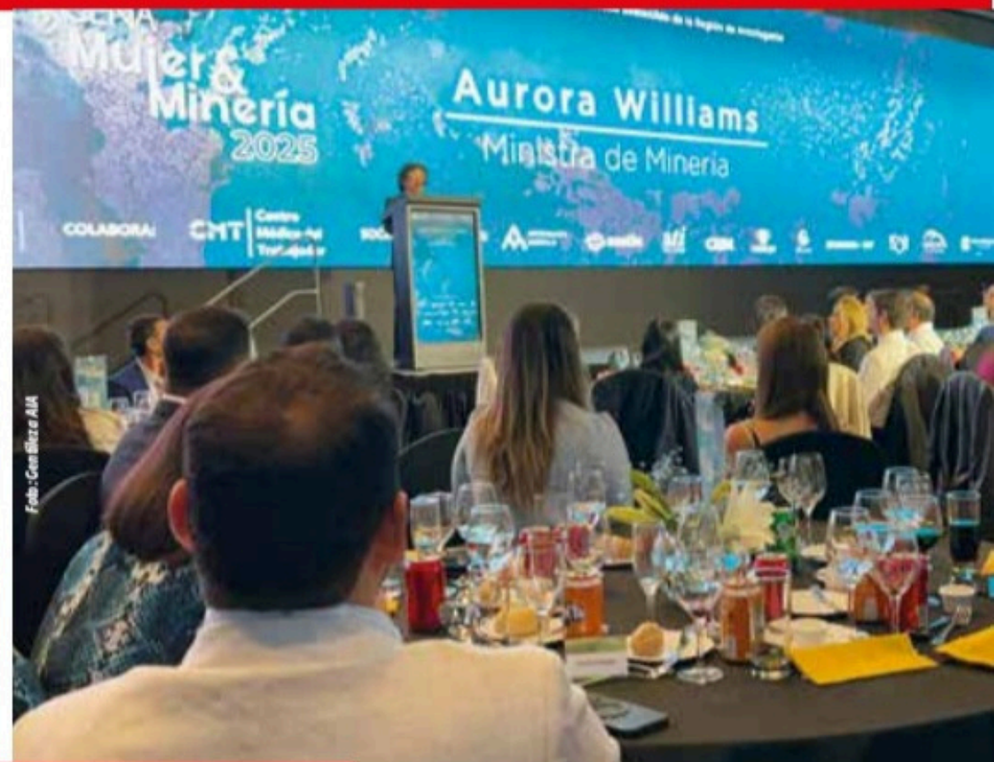
Foto Der.: Encuentro Mujer & Minería, organizado por la Asociación de Industriales de Antofagasta.

de largo plazo que se expresan en los territorios y afectan a muchas personas: uso de recursos naturales, exigencias ambientales, seguridad, empleo, encadenamientos productivos y convivencia con comunidades.