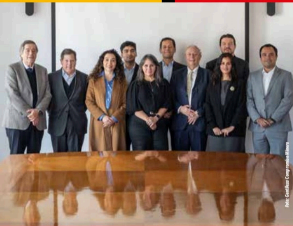
Foto Izq.: Compromiso Minero agrupa a diversos actores del ecosistema.