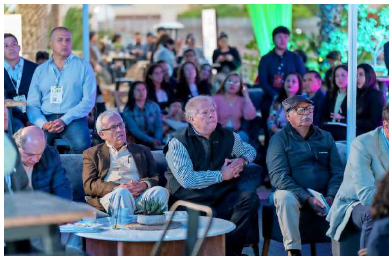
Autoridades, proveedores, colaboradores, miembros de la academia y representantes de SQM fueron parte de los asistentes.

Finalmente, SQM extiende una invitación a todos sus colaboradores a sumarse activamente a los procesos de innovación. Su participación, creatividad y compromiso son elementos clave para que la compañía continúe posicionándose como una empresa líder en sostenibilidad, creatividad e impacto positivo.