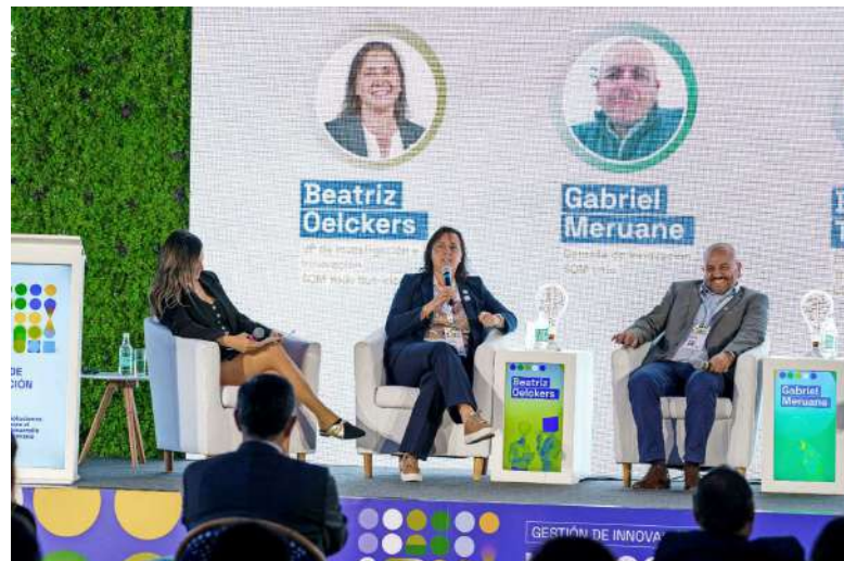
La ceremonia incluyó un conversatorio con líderes de innovación y un panel de reflexión sobre la colaboración público-privada.