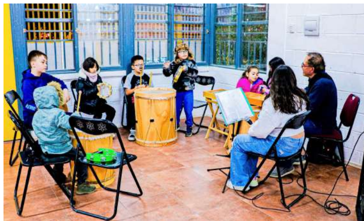
El impacto ha sido tan positivo que los estudiantes avanzados formaron una banda que difundió su arte en redes sociales.