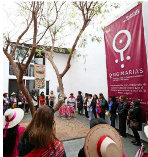
El proyecto ha entregado más de $170 millones en fondos para negocios y más de 10.000 horas de formación.