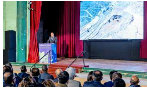
Desde 2021, los índices de accidentabilidad del rubro han ido descendiendo paulatinamente, según Sernameomin.

A su vez, Minera Candelaria se enfoca en las localidades de Tierra Amarilla, Caldera y Copiapó. Ahí, desde 2020, ha entregado diez cursos para más de 230 vecinos sobre instalación y mantenimiento de paneles solares. Estas capacitaciones permiten hoy que pescadores, emprendedores y familias de esas comunas implementen soluciones energéticas sostenibles, reforzando la autogestión comunitaria.