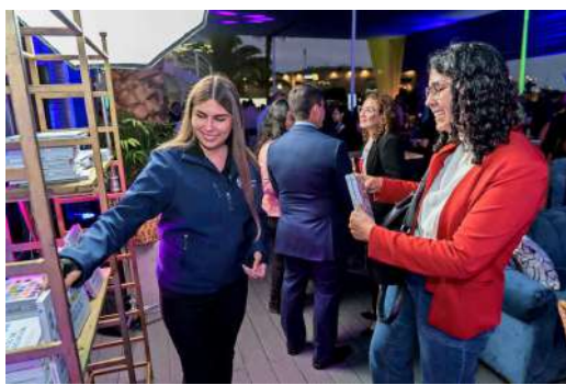
La iniciativa reafirma el compromiso de la compañía con el impulso de ecosistemas productivos.

compromiso de nuestros equipos en crear soluciones que no solo beneficien a la empresa, sino que también se conviertan en oportunidades de crecimiento para