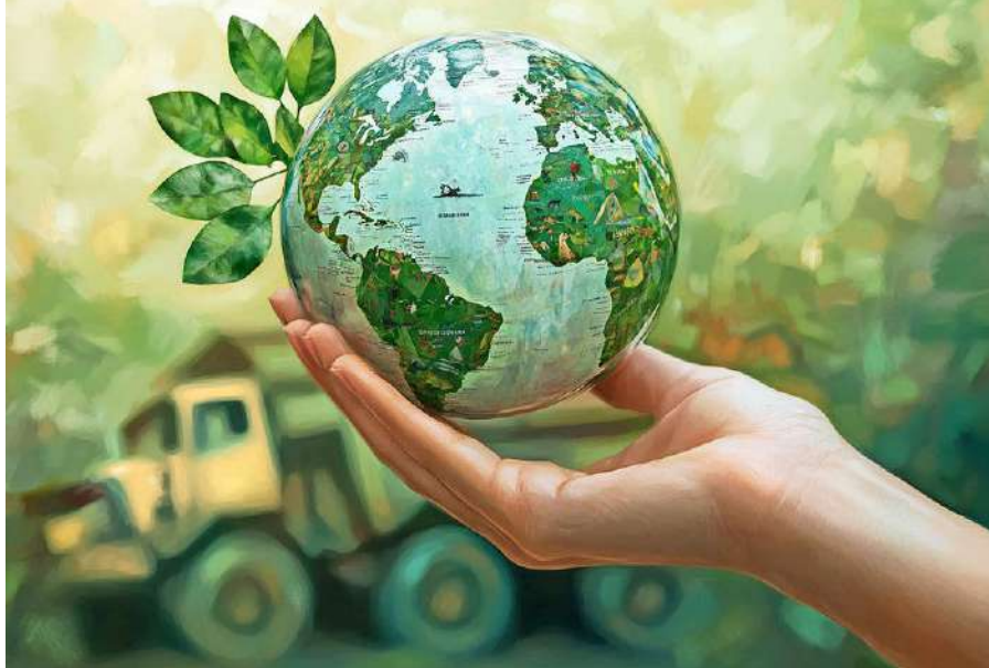
ILUSTRACIÓN: HYPO PHOTOS

Según una encuesta de Aprimin, casi el 73% de sus socios cuenta con políticas de sustentabilidad.